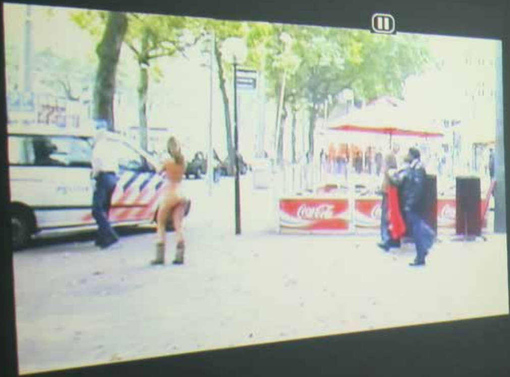
Foto van vertoning video performance Naakte wandeling in Galerie Sign. Het moment dat ik werd opgepakt door de politie.